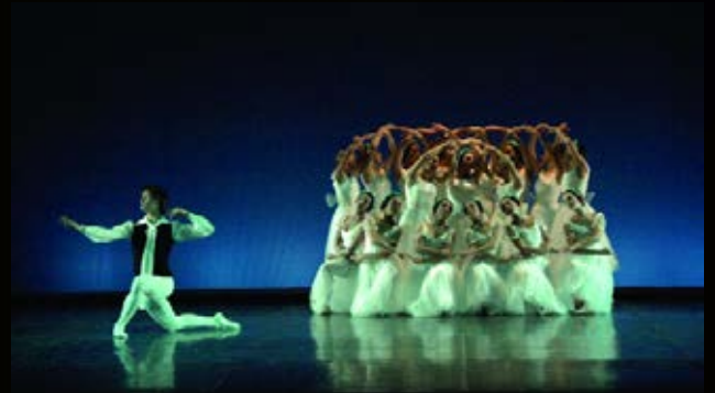
BCM en Sílfides