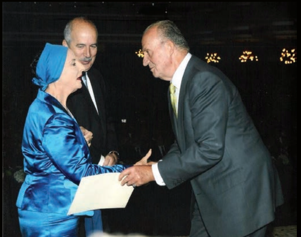
Su Majestad el Rey Don Juan Carlos entrega la Medalla de Oro a las Bellas Artes a Dña. Alicia Alonso